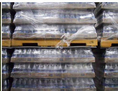
二段積み荷物の間材